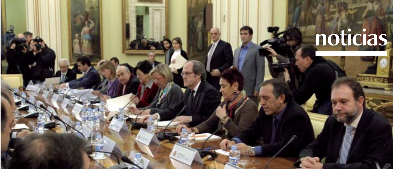
El ministro de Educación, Ángel Gabilondo, altos cargos del Ministerio y los consejeros de Educación de las comunidades autónomas durante la reunión de la Conferencia Sectorial que mantuvieron el pasado 27 de enero, en la que se presentó la propuesta de Pacto educativo.