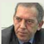
MIGUEL SOLER/ Director general de FP del Ministerio de Educación

En el cambio hacia un nuevo modelo productivo basado en el conocimiento y en una oferta más diversa, es clave una cualificación profesional de más calidad, lo que depende de la oferta de ciclos formativos. Pese a haber una mayor demanda hay menos financiación. Administraciones, patronales y sindicatos debemos alcanzar un gran acuerdo para la FP que favorezca el aumento de la oferta de títulos y de los Programas PCPI. Por lo que respecta a los PCPIs, vemos negativo que la LES y la Ley Orgánica Complementaria, no establezcan con carácter básico la duración de dos cursos.