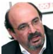
José Campos Trujillo Secretario General FE CCOO

CCOO y UGT hemos recurrido a la Iniciativa Legislativa Popular (ILP) por el Empleo Estable y con Derechos para neutralizar los elementos negativos esenciales de la reforma laboral. En los diez meses desde su aprobación hemos visto que con esta reforma ni se crea empleo ni estabilidad laboral. Por el contrario, al abaratar el despido ha facilitado la destrucción de decenas de miles