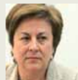
CÁNDIDA MARTÍNEZ/ Portavoz de Educación del PSOE en el Congreso

Me preocupa que, bajo el criterio de la flexibilización, se desprestigie la FP. Toda innovación supone un incremento de coste, por lo que si se proponen cursos de especialización, habrá que saber antes quién va a pagarlos en un momento en que las comunidades autónomas no disponen de dinero. La Formación Profesional deberían depender de Presidencia del Gobierno.