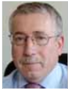
Ignacio Fernández Toxo Secretario general de CCOO