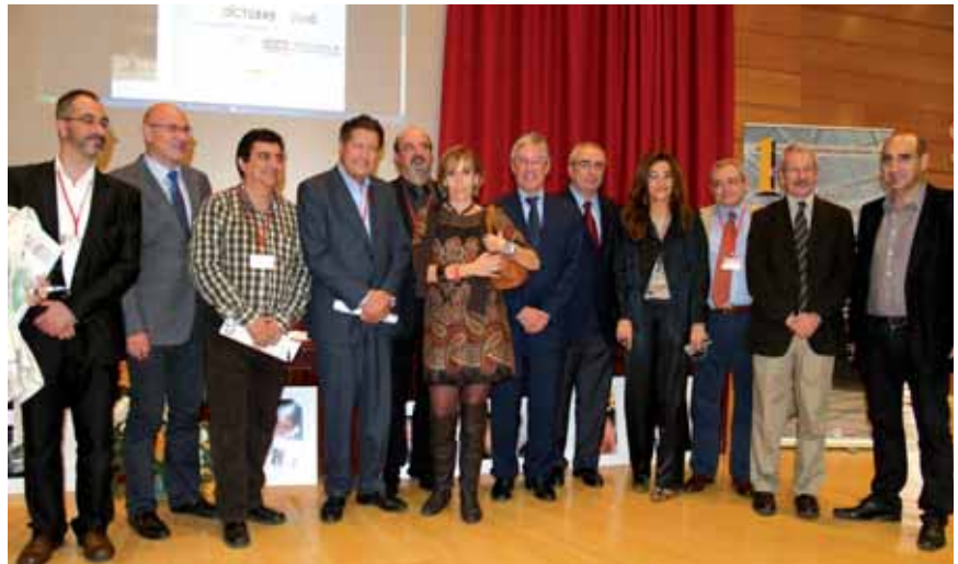
Organizadores y expertos que participaron en el Primer Congreso sobre Buenas Prácticas en Educación Intercultural

Alrededor de 250 participantes se acreditaron en el congreso y se recibie-