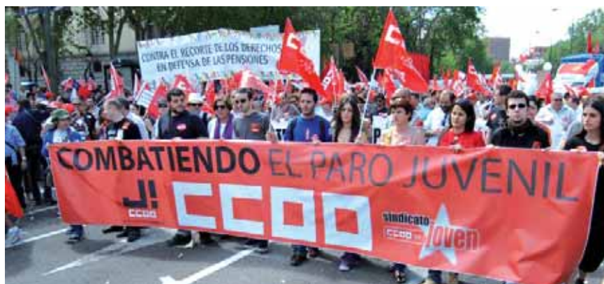
CCOO seguirá estando ahí, en la calle, al lado de los menos favorecidos, con quienes tienen más dificultades

Tal es el caso de que en un curso en el que el alumnado se sitúa en