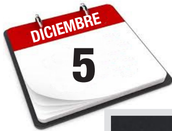
Reunión de Coordinación de los sindicatos: participación de Unai Sordo