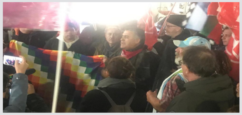
Concentración frente a la embajada de Chile