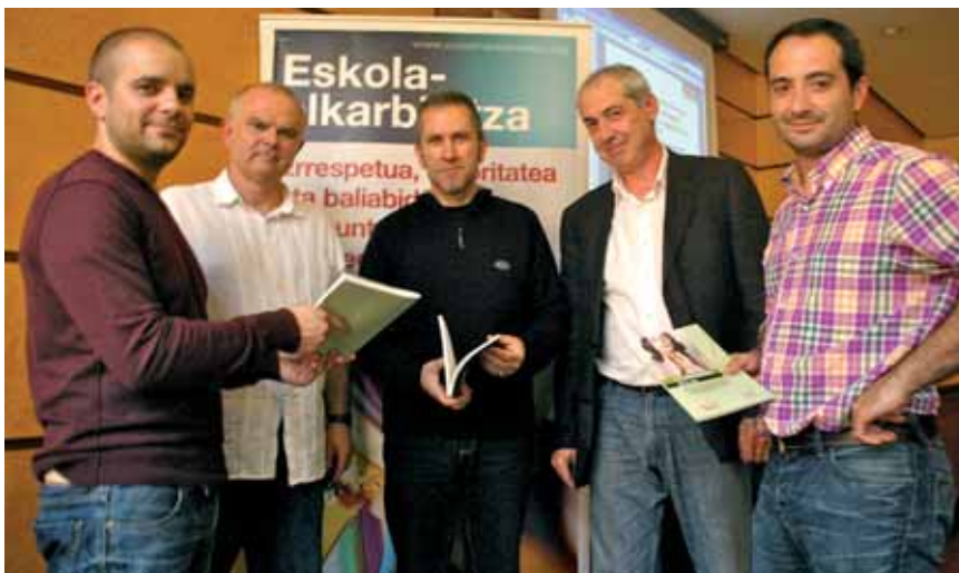
Acto de presentación de los libros "Enfermedades de la voz" y "Práctica educativa y salud docente" por la Federación de Enseñanza de CCOO en Bilbao el pasado 28 de abril, Día Internacional de Salud Laboral.