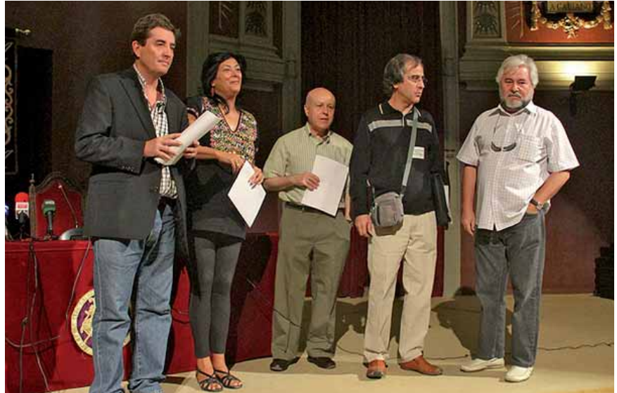
De izquierda a derecha los escritores Luis García Montero y Almudena Grandes, junto a los profesores que presentaron en el Ateneo de Madrid el Manifiesto contra los recortes.

Para los firmantes del Manifiesto resulta especialmente preocupante el modelo que quiere imponer el Gobierno de la Comunidad de Madrid, que tiende a crear guetos y a profundizar la brecha de desigualdades económicas y sociales.