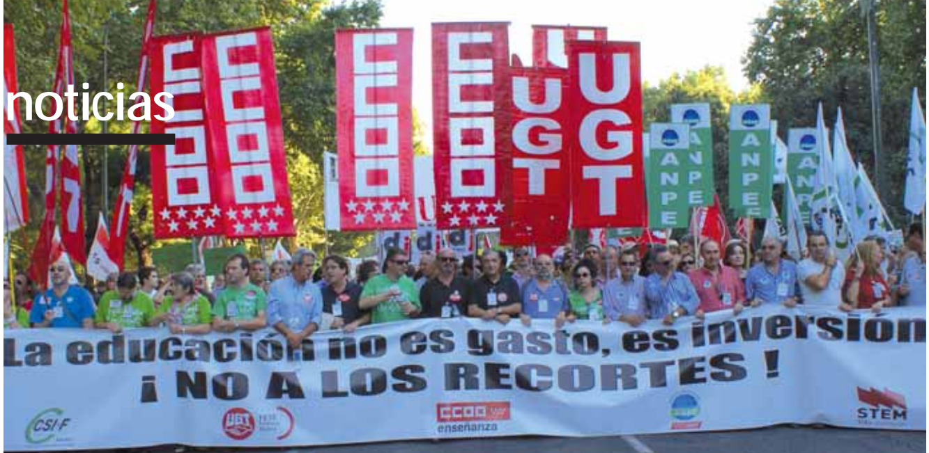
Cabecera de la manifestación que el pasado 20 de septiembre congregó en Madrid a miles de profesores y profesoras de la enseñanza pública